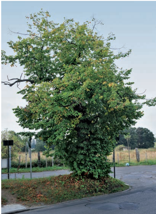
Fig. 1 Le Kasterlinde, rue Kasterlinden, Berchem-Sainte-Agathe (M. Vanhulst, 2012 ©MRBC).