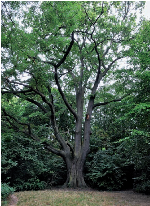
Fig. 3 Chêne pédonculé, parc Jacques Brel, Forest.