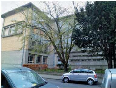
Fig. 5 Ostrya, rue Fivé, Etterbeek.