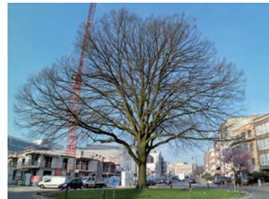
Fig. 7 Tilleul argenté, boulevard des Invalides, Auderghem.

cm en 2008. La présence d'une borne aux armoiries de la commune signale son caractère commémoratif. Enfin deux tilleuls indigènes sont à signaler, celui à petites feuilles ( Tilia cordata ) au square de l'Arbalète (Watermael-Boitsfort), avec son tronc de 239 cm de circonférence (2012) et celui à larges feuilles ( T. platyphyllos ) à la place Saint-Vincent (Evere), au tronc de 217 cm (2012) et de 19 m de hauteur.