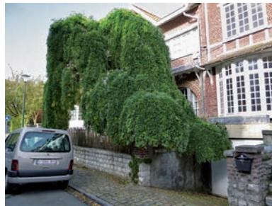
Fig. 6 Sophora pleureur, avenue du Beau-Séjour, Uccle.