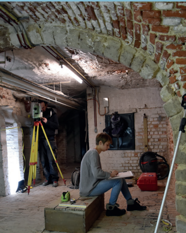
Cave de la maison rue de la Tête d'Or 5 (XVI e siècle). Étudiants et archéologues de l'ULB au travail. Kelder van het huis in de Guldenhoofdstraat 5 (16de eeuw). Studenten en archeologen van de ULB aan het werk.