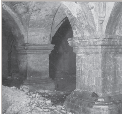
Cave de la Domus Isabellae en 1909, état de conservation actuel inconnu dans le sous-sol de la rue Baron Horta (© KIK-IRPA). Kelder van het Domus Isabellae en 1909, in de ondergrond van de Baron Hortastraat, de huidige bewaringstoestand is niet gekend (© KIK-IRPA).