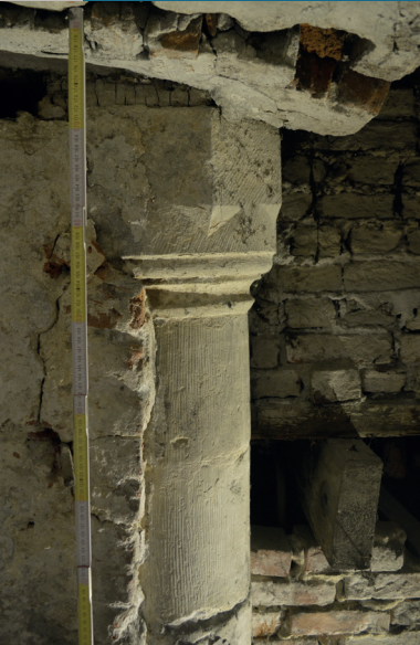
Colonne avec chapiteau sculpté dans la cave du café Manneken Pis (1 er tiers du XVI e siècle). Kolom met gesculpteerd kapiteel in de kelder van café Manneken Pis (1ste derde 16de eeuw).