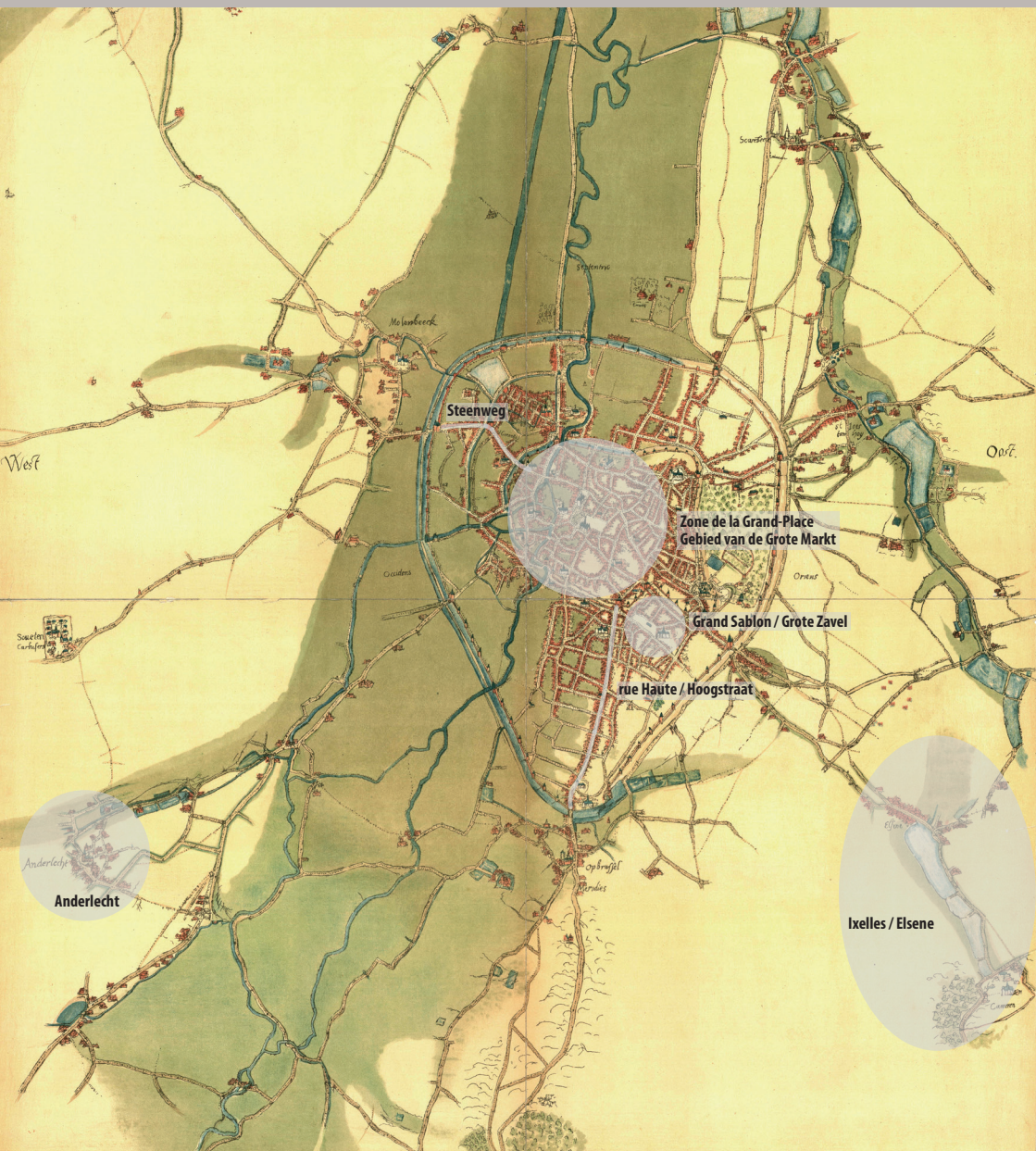
Carte de Jacques de Deventer (milieu du XVI e siècle) indiquant les zones étudiées en priorité (© BRB, Cartes et Plans). Plattegrond van Jacob van Deventer (midden 16de eeuw), met de bij voorrang bestudeerde zones (© KBB, Kaarten en Plattegronden).