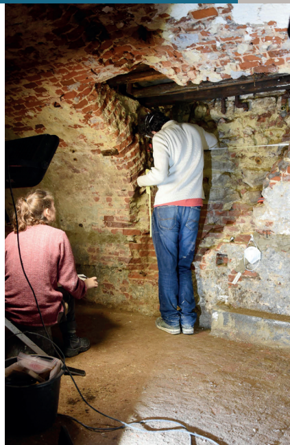
Cave, rue des Dominicains 22. Étudiants effectuant le relevé d'une maçonnerie datée des XIV e -XVI e siècles.

Deze onlangs onderzochte kelders wijzen ons de weg. Ze illustreren de bijdrage van het project aan de kennis van het erfgoed en geven een idee van wat er bij u zou kunnen worden ondernomen. Binnenkort dus ook in uw kelder?