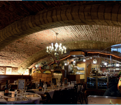
Cave du restaurant La Cave du Roy , Grand-Place 14 (milieu du XV e siècle). Kelder van het restaurant La Cave du Roy , Grote Markt 14 (midden 15de eeuw).