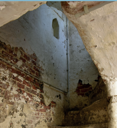
Café À l' Imaige Notre Dame , impasse des Cadeaux 3. Niche à bougie au départ de l'escalier menant à la cave (fin XVII e siècle ?). Café À l' Imaige Notre Dame , Geschenkengang 3. Kaarsnis zichtbaar vanop de trap die naar de kelder leidt (eind 17de eeuw?).