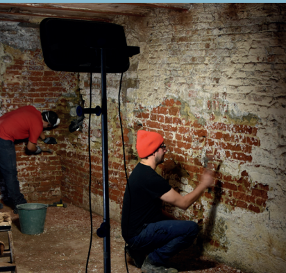
Cave, rue des Dominicains 24 (XV e -XVI e siècles). Étudiants et archéologues à l'œuvre. Kelder in de Predikherenstraat 24 (15de-16de eeuw). Studenten en archeologen aan het werk.

Croquis pris sur le vif représentant cinq hommes devant une entrée de cave, remontant ou descendant une charge, par Gérard ter Borch II.