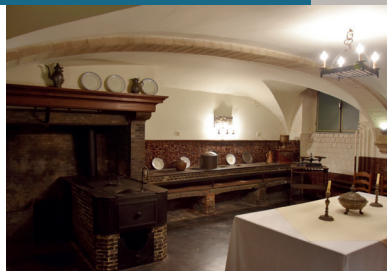
Cave-cuisine de la maison dite « patricienne », rue du Chêne 10.

Door de archeologische informatie en de inlichtingen uit de archieven naast elkaar te leggen, krijgen we een overzicht dat ons letterlijk toelaat de geschiedenis te schrijven van een huis en een kelder.