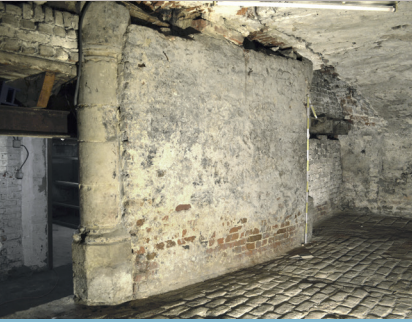
Cave du café Manneken Pis , à l'angle des rues de l'Étuve et des Grands-Carmes, 1 er tiers du XVI e siècle. De kelder van het café Manneken Pis , op de hoek van de Stooftstraat en de Lievevroubroersstraat, 1ste derde 16de eeuw.