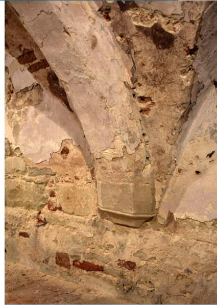
Grand-Place 39, maison dite l'Âne. Arc doubleau du XIV e ou XV e siècle.

H et project beoogt de volledige Vijfhoek te inventariseren alsook de oude dorpskernen die vandaag deel uitmaken van het Gewest. Enkele veelbelovende zones krijgen voorrang in het onderzoek. Eerst zal de studie worden toegespitst op de UNESCO-beschermingszone rond de Grote Markt en op verschillende belangrijke historische wijken: de sectoren van de Sint-Katelijnestraat en de Vlaamsesteenweg (de befaamde steenweg in de benedenstad), van de Kapellewijk (Hoogstraat en aanpalende straten) en van de Zavel. Vervolgens zal men zich geheel richten op de vroegere landbouwzone en het historische centrum van het dorp Anderlecht (het huidige Dapperheidsplein en omgeving) wat na studie een vergelijking moet mogelijk maken met de nederzetting die ontstond in de nabijheid van de castrale motte van de familie van de heren van Anderlecht en rond hun collegiale kerk.