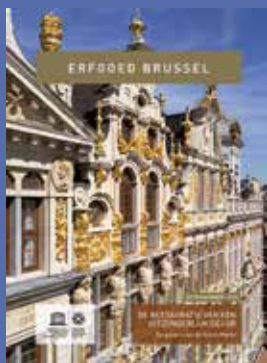
Extra nummer - 2018 De restauratie van een uitzonderlijk decor