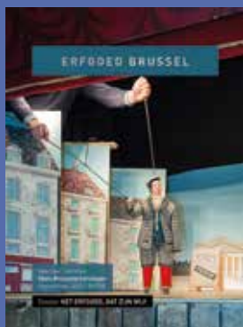
028 - September 2018 Het Erfgoed, dat zijn wij!