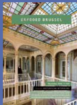
029 - December 2018 Historische Interieurs