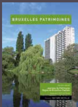
023-024 - Septembre 2017 Nature en ville