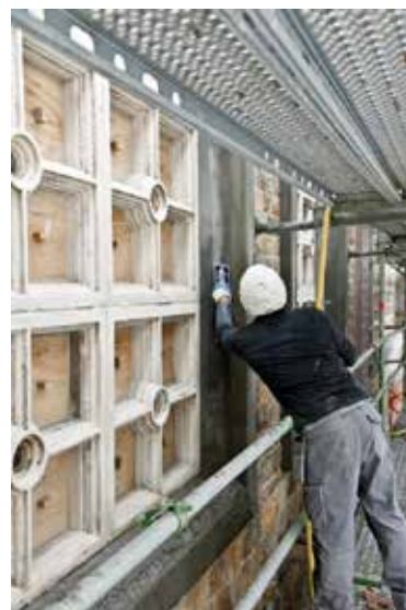
(A. de Ville de Goyet, 2016 © BUP/BSE)

grâce à une étude préalable approfondie et à des essais de restauration, a mis au point une méthodologie rigoureuse afin de restaurer le monument de la manière la plus respectueuse possible. Dès la phase de conception, la Direction des Monuments et Sites (DMS) a été associée à cet ambitieux projet, pour lequel le permis a été délivré le 8 septembre 2014. Le chantier, qui a démarré fin 2014, se déroule également en étroite concertation avec la DMS. La Région subventionne 80 % des travaux de restauration, ce qui correspond à un montant approchant les 5.800.000 euros.