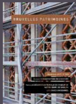
025 - Décembre 2017 Conservation en chantier